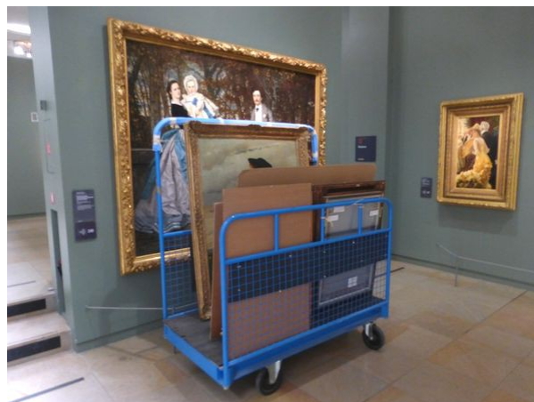
Lundi fermé 31 août 2015 : infiltrations d'eau, mise à l'abri des œuvres en réserve

centre médical de Villejuif ont été accueillis par l'entrée quai Montherlant, pour une visite du musée d'Orsay hors collections permanentes (en entretien/maintenance).