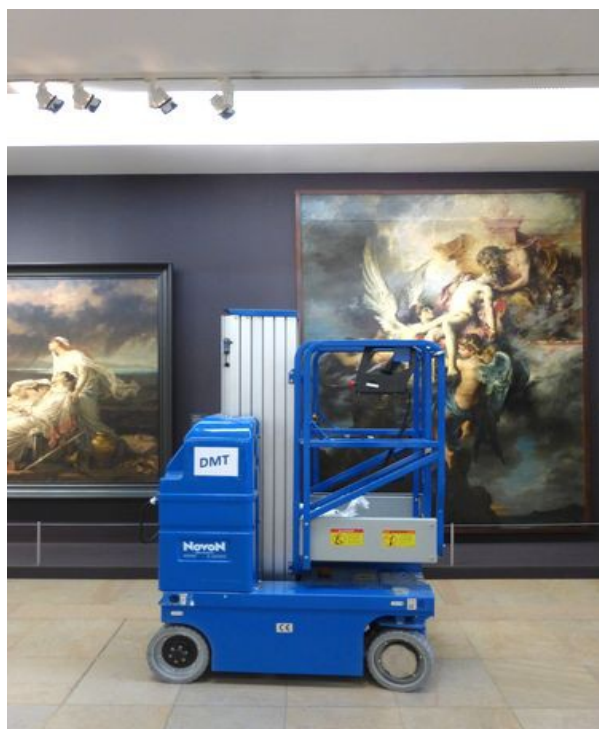
Lundi fermé 21 septembre 2015 : RdChaussée galerie Seine