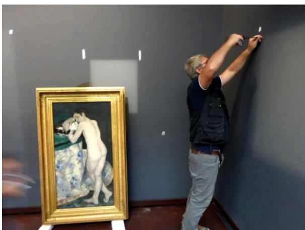
Lundi fermé 21 septembre 2015. 5 e étage

La priorité devrait selon la CGT être donnée à la réalisation des projets annoncés dans des documents récents qui ont été soumis pour avis.