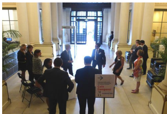
Lundi 14 septembre 2015 : Entrée d'honneur quai Montherlant

Un accord a bien été conclu jeudi 24 septembre en fin de matinée sur des engagements écrits de l'administrateur général, Alain Lombard, au sujet de « l'accès du musée d'Orsay aux groupes scolaires le lundi », selon le titre d'une note aux personnels du musée signée du président de l'établissement, Guy Cogeval, adressée la veille 22 septembre, au soir du premier jour de grève. Il ne s'agit donc pas d'une ouverture publique 7 jours sur 7.