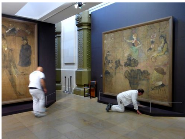
Lundi fermé 21 septembre 2015 : RC galerie Lille : nettoyage et remise en état des mises à distance