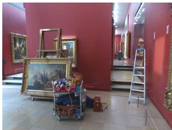
Lundi fermé 31 août 2015 : accrochages dans la galerie « Luxembourg »

C'est pourquoi le nombre de groupes accueillis le jour de fermeture ne peut être que très limité. La CGT préconise de réserver le jour de fermeture aux publics spécifiques qui ne peuvent pas, pour des raisons matérielles et physiques, visiter le musée d'Orsay les jours d'ouverture publique en présence du flux des visiteurs individuels.