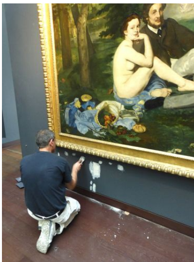
Lundi fermé 21 septembre 2015 :

Il faut également rester très vigilant quant au projet de cloisonnement pérenne des secteurs muséographiques par des portes, évoqué par la direction M'O au CHSCT du 2 juillet 2015, car cela permettrait alors de fermer par rotation des secteurs entiers du musée, ce à quoi la CGT est très défavorable.