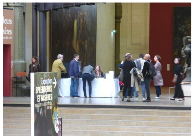
Lundi fermé 21 septembre 2015 : plusieurs centaines d'invités à l'inauguration de l'expo prostitution, de 14 à 18 h.

Cela creuse encore davantage le fossé avec tous les établissements plus modestes qui peinent à attirer les scolaires, en dépit des efforts qu'ils déploient en ce sens.