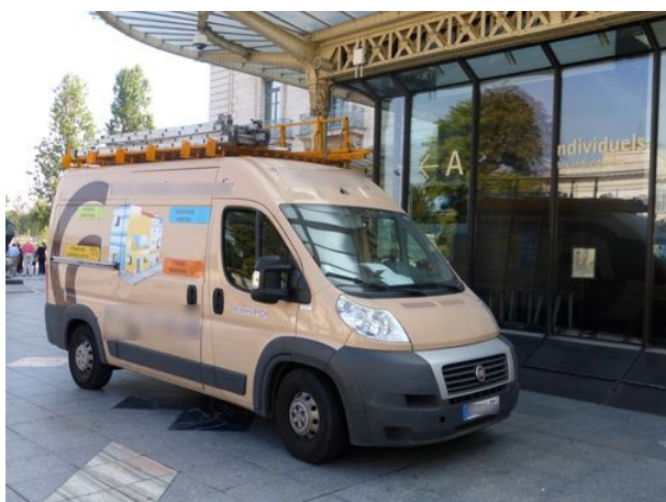
Lundi fermé 8 septembre 2014 : remplacement des vitres cassées de l'entrée publique