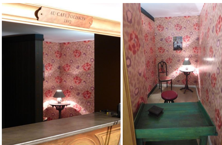
Septembre 2015 : Café polisson lupanar, bar à ressources propres