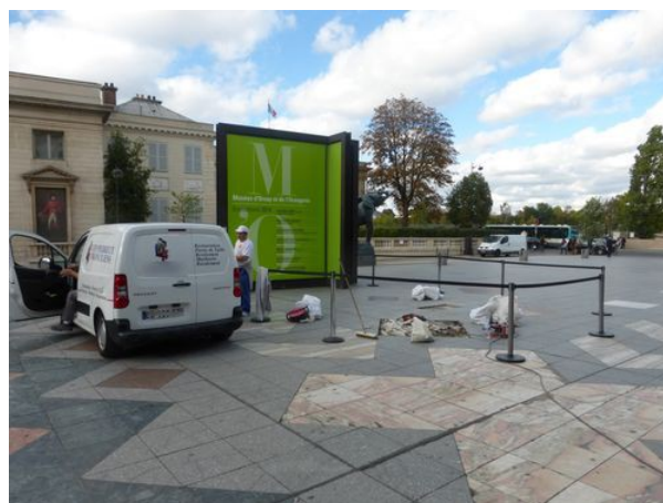
Lundi fermé 13 octobre 2014 : remplacement des dalles cassées du parvis des entrées

La question reste ouverte. Il existe plusieurs réponses.