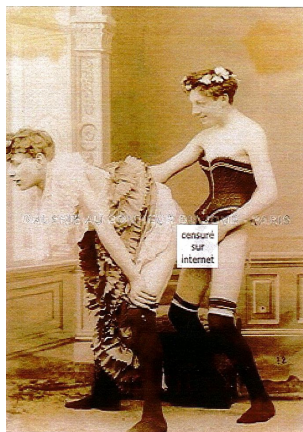
Anonyme , Jeunes hommes dans une maison close , 1895.

Expo « Courtisanes » : encore une sélection d'œuvres « audacieuse » et qui « secoue le musée » :